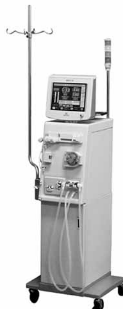
セントラル方式透析器