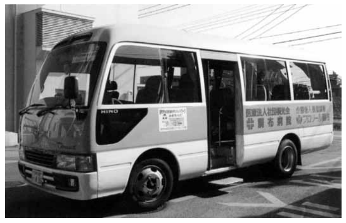
京王多摩川駅経由、京王多摩川からの送迎バスの時刻は調布駅発3～5分後です。日曜祝祭日は運行しておりません。